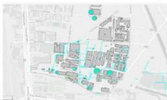
Qualité de l'eau