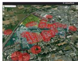
Gestion des déchets