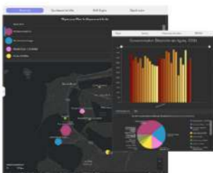
Monitoring énergie / Climat