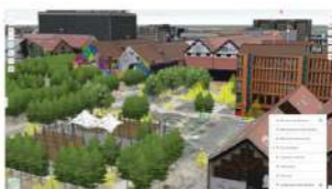
Biodiversité Vue 3D

Gagner du temps et capitaliser vos investissements En continuité digitale interopérabilité BIM / CIM