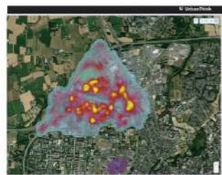
Ilots de chaleur Qualité de l'air